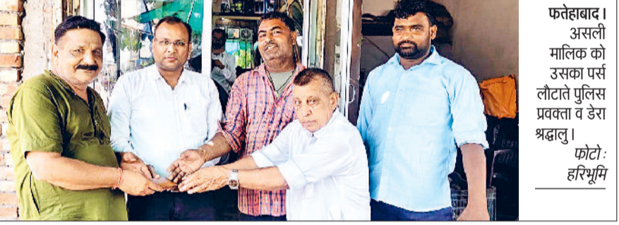
फतेहाबाद। असली मालिक को उसका पर्स लौटाते पुलिस प्रवक्ता व डेरा श्रद्धालु।