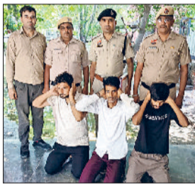
हत्या मामले में पकड़े गए आरोपी।