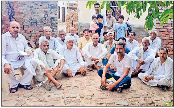
भट्टकलां। गांव ढाबी कलां में आयोजित बैठक में भाग लेते किसान।