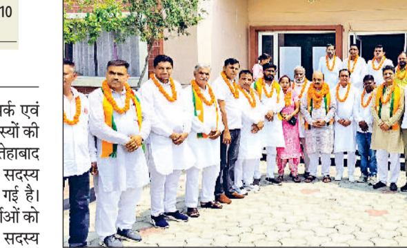
फतेहाबाद। शीघ्रैस कमेटी के नवनियुक्त सदस्यों को बधाई देते भाजपा जिलाध्यक्ष।