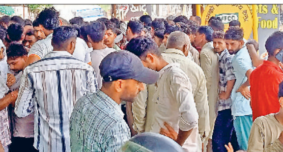
सिरसा। इफको केंद्र में खाद लेने पहुंची किसानों की भीड़।

नाथूसरी चोपटा में इफको केंद्र पर डीएपी खाद के एक ट्रक के पहुंचते ही शुक्रवार को किसानों की भीड़ उमड़ गई। हालात को नियंत्रित करने के लिए पुलिस को बुलाना पड़ा। पुलिस की मौजूदगी में खाद वितरित की गई। जानकारी के अनुसार चोपटा के खाद वितरण केंद्र पर डीएपी खाद से लदा एक ट्रक आया था, जिसमें 500 बैग