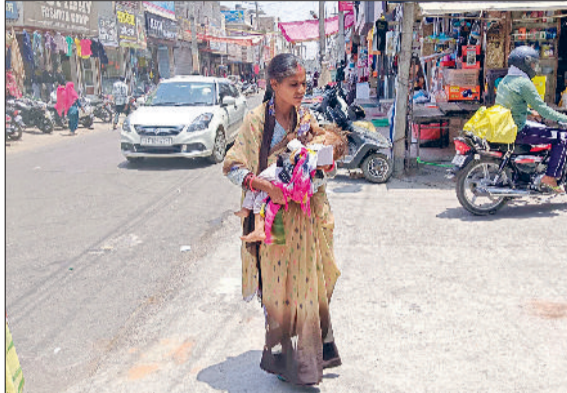
फतेहाबाद। गर्मी में अपने बच्चे को लेकर जाती महिला।

फतेहाबाद में वीरवार को मानसून की पहली जबरदस्त हुई बरसात के दूसरे दिन शुक्रवार को मौसम फिर पहले जैसी स्थिति में आ गया। शुक्रवार को तेज धूप और उमस से लोग बेहाल दिखाई दिए। अगले दो दिनों में नमी वाली हवाएं चलने से मौसम विभाग ने 28 व 29 जून को फिर बारिश की संभावना जताई है। यह बारिश 2 से 3 जुलाई तक लगातार चार दिन पूरे हरियाणा में मानसून को कवर करेगी। शुक्रवार को फतेहाबाद का अधिकतम तापमान 36 डिग्री तथा न्यूनतम तापमान 28 डिग्री सेल्सियस दर्ज किया है। हवा में नमी की मात्रा 61 प्रतिशत रही। बता दें कि वीरवार को फतेहाबाद में एक घंटे में ही 76 एमएम पानी बरसा जिससे लोगों के चेहरों पर रौनक लौट आई। आज दूसरे दिन मौसम फिर पहले जैसी स्थिति में आ गया। हालांकि शुक्रवार को हिसार एचएयू के