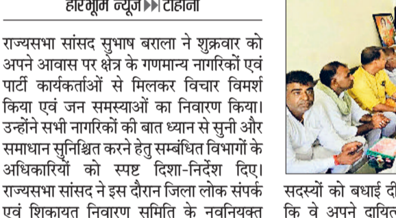
दोहाना। लोगों की शिकायतें सुनते सांसद सुभाष बराला।

सदस्यों को बधाई दी और विश्वास व्यक्त किया कि वे अपने दायित्वों का निर्वहन पूरी निष्ठा, सजगता और जिम्मेदारी के साथ करेंगे। सांसद सुभाष बराला ने कहा जनता से सीधा संवाद ही लोकतंत्र की सबसे बड़ी ताकत है। सांसद ने कहा कि केंद्र सरकार प्रधानमंत्री नरेंद्र मोदी के नेतृत्व में तथा राज्य सरकार मुख्यमंत्री नायब सिंह सैनी के मार्गदर्शन में देश के विकास और प्रगति का